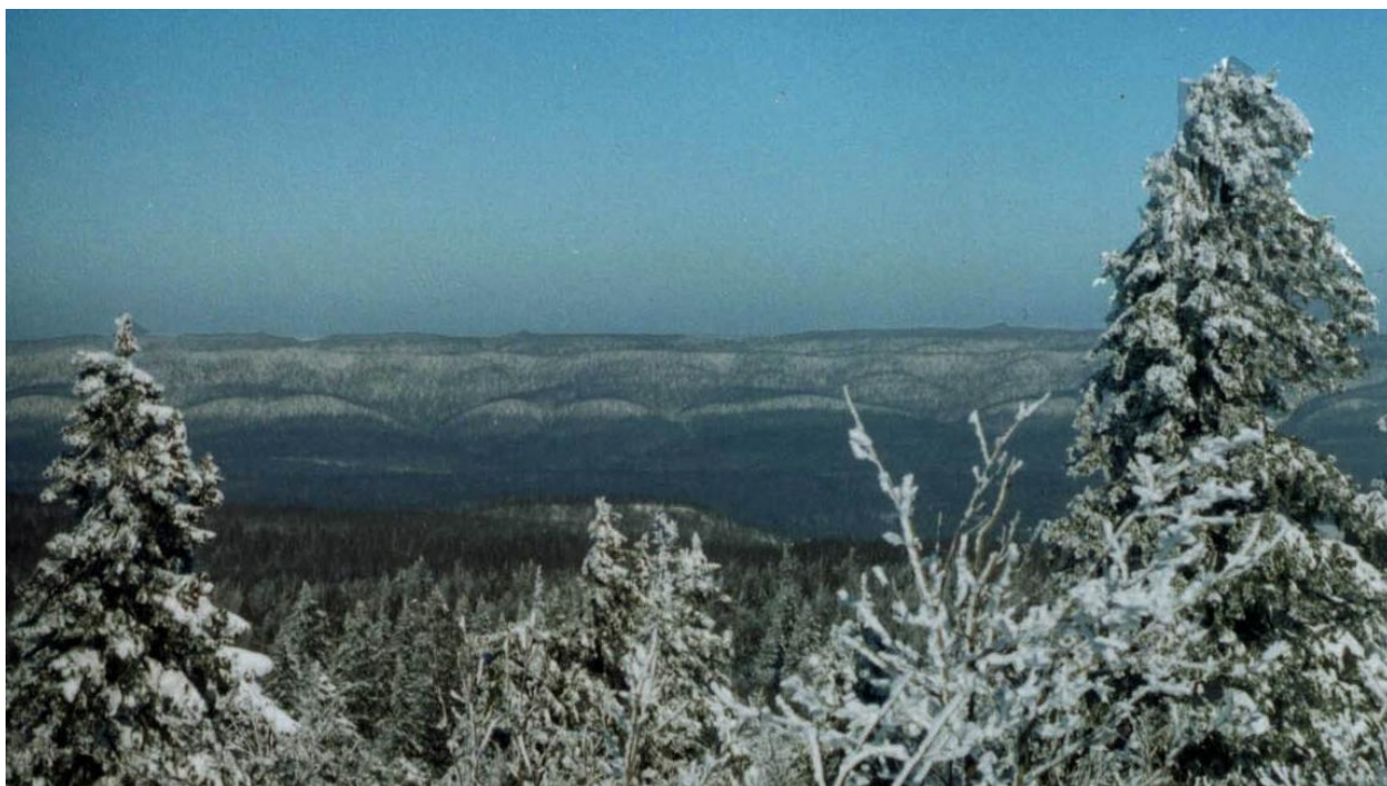
Вид на Воробьиные горы с горы Аджигардак

На западе Челябинской области от города Аши до города Миньяр на 25 км растянулись Воробьиные горы. Хребет сложен осадочными породами. С хребта берет начало множество ручьев, вода из которых используется для водоснабжения городов Аша и Миньяр.