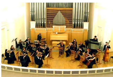
2. Камерный оркестр 3. Джазовый оркестр